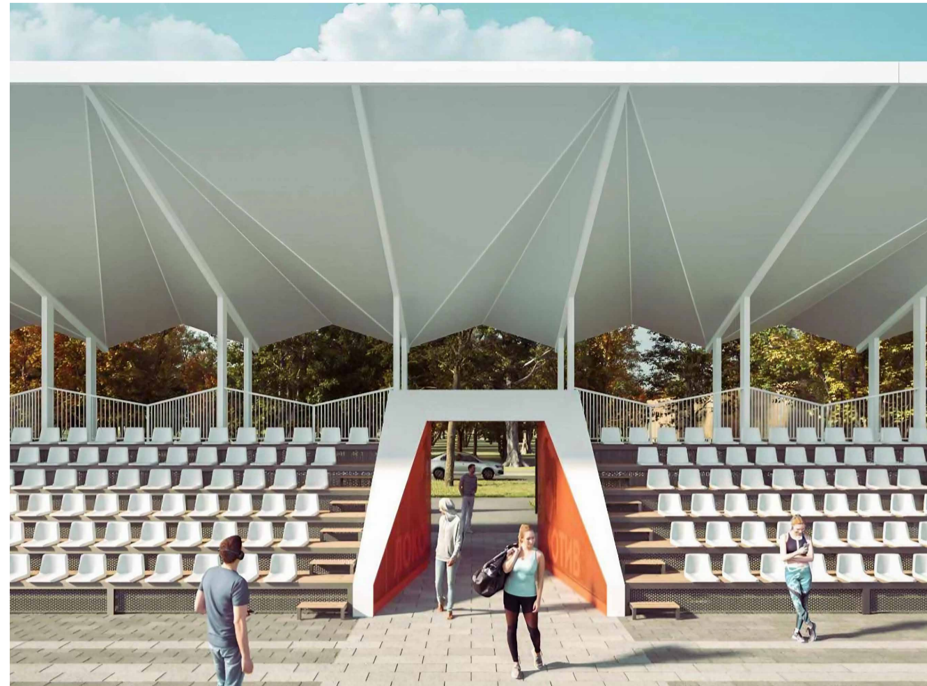
Стадион «Локомотив» в ЮВАО

Для создания разгонной секции использовали морские контейнеры. В последнее время их стали применять для организации различных пространств. Они легко компонуются и крепятся между собой, а высота двух контейнеров совпала с требованием спортсменов к высоте разгонной секции относительно масштаба фигур.