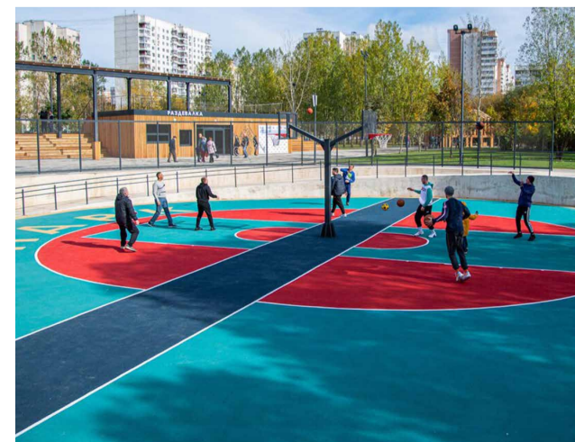
Спортивные площадки парка «Яуза»

части заброшенной. Зато теперь – пожалуйста: тренажеров и спортивных площадок на любой вкус. Мы с ребятами забегает в воркаут-зону. Турники и брусья сегодня есть в каждом дворе, но тренироваться одному скучно, а здесь много единомышленников, тех, кто тебе что-то дельное подскажет. В парке также в футбол и в стритбол играем. Появится настроение, могу вытащить с балкона велосипед и покатаюсь по дорожкам. Папа с мамой здесь бегают по утрам, когда не ленятся. Да и кроме спорта в парке есть чем заняться. В общем, замечательное место».