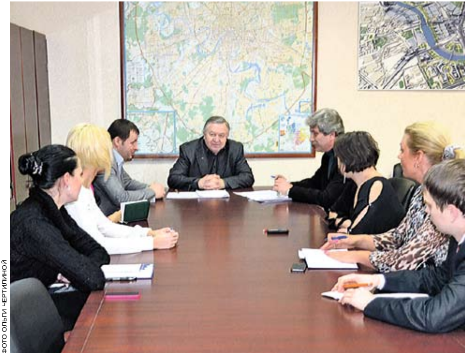
Встреча с молодыми специалистами в горкоме профсоюза строителей

— Не только заключенных, но и последовательно выполняемых. Отдельно хочется подчеркнуть растущее сотрудничество руководства стройкомплекса Москвы с горкомом нашего профсоюза. Это дает огромные возможности для того, чтобы добиваться новых успехов в развитии отрасли, в дальнейшем повышении зарплат и в целом уровня жизни строителей.