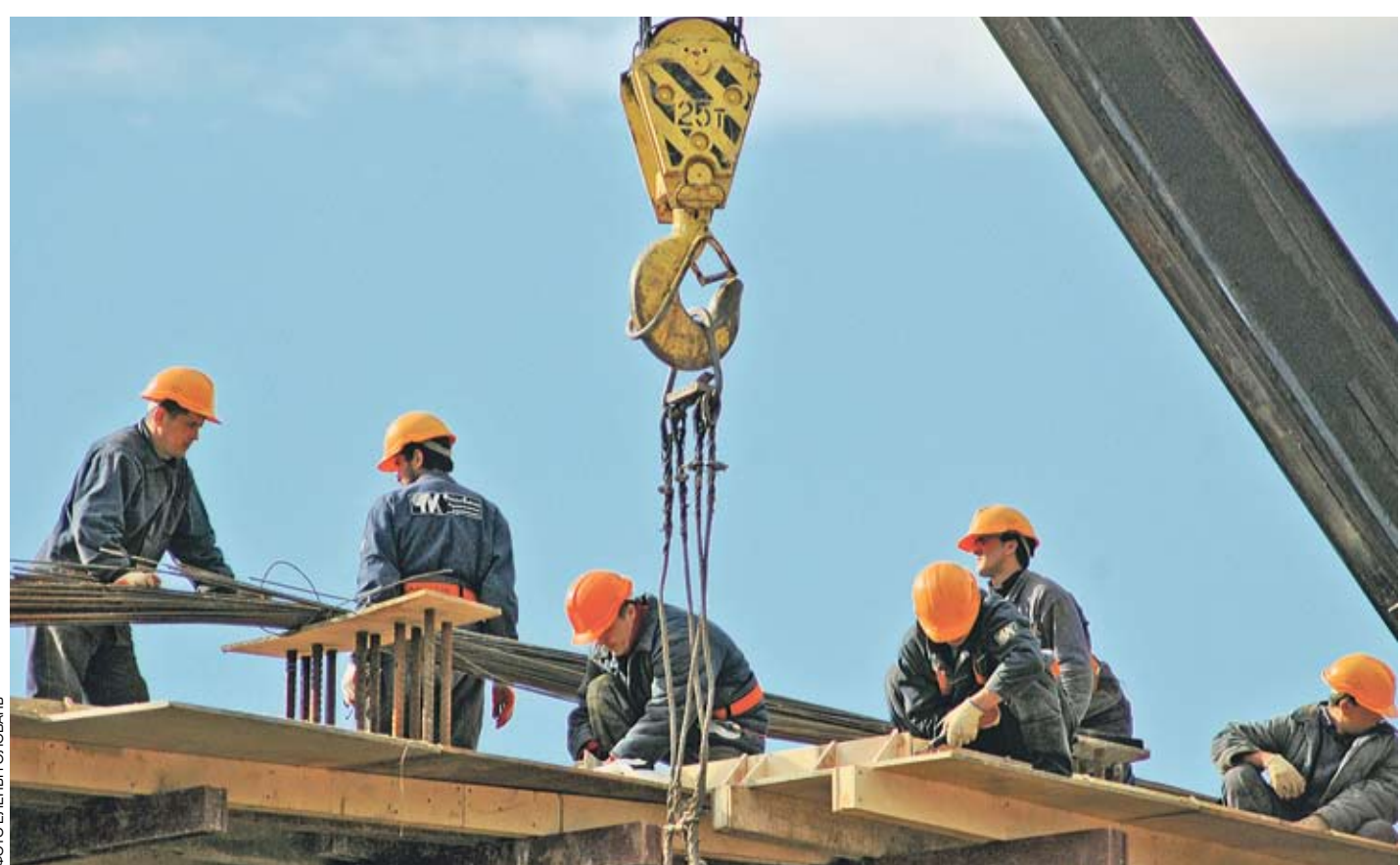
Строителей защитит «трехсторонка»

По сравнению с предыдущим соглашением число социальных обязательств возросло на 30%. Оно впервые охватывает не два, а сразу три года.