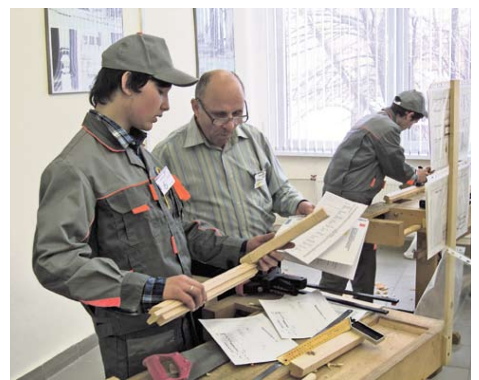
На конкурсе профессионального мастерства среди учащихся колледжей