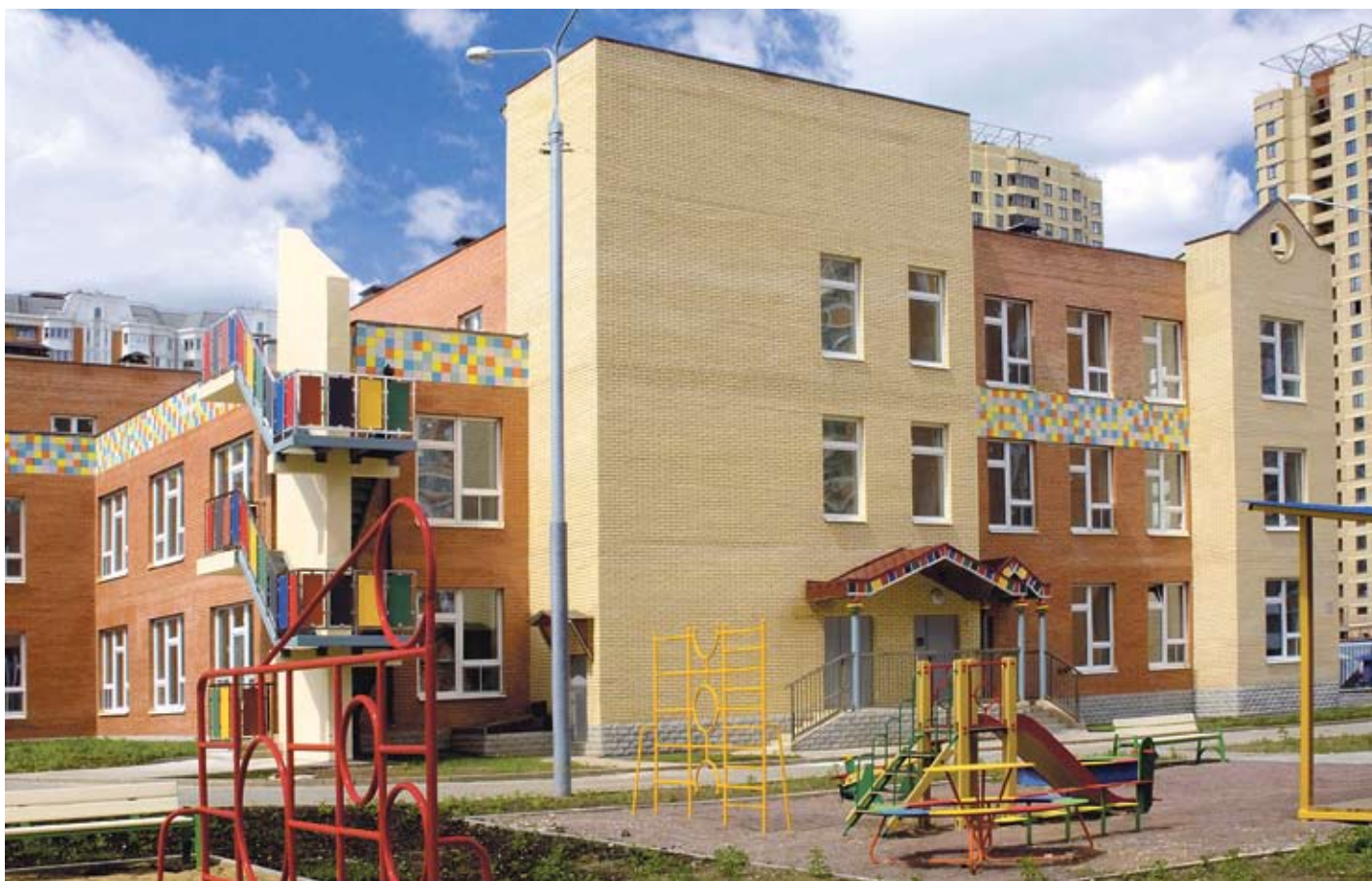
Детский сад «Янтарный островок», мкрн «Янтарный», г. Балашиха

За последние три года в рамках реализации комплексной программы развития социальной инфраструктуры Московской области компания открыла 10 детских садов и школ на 2400 мест. В первом полугодии 2013 года ГК выделила около одного миллиарда рублей на строительство школы и двух детских садов в Балашихе, а всего к концу этого года ГК «Мортон» построит и сдаст в сумме 9 школ и садики на 2650 мест в своих микрорайонах «Катюшки» (г. Лобня), «Завидное» (г. Видное), Мортонград «Бутово» (Ленинский р-н), «30-й микрорайон», «Шитниково» и «Сакраменто» (г. о. Балашиха).