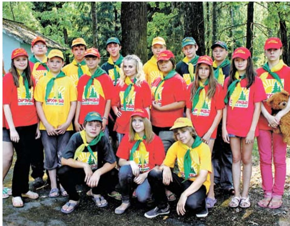
В ведомственном детском оздоровительном лагере

— Об отдыхе детей строителей мы всегда помним. Горкомовские инспекторы совместно с городскими службами провели комплексную проверку подготовленности к летнему приему ребят во всех шести подмосковных ведомственных детских здравницах. В прошлом году в них хорошо отдохнули по льготным путевкам (за 10% от всей стоимости для полных семей и бесплатно для неполных и многодетных) около 8 тысяч школьников. Еще полторы тысячи их сверстников укрепили здоровье на Черном море. Не