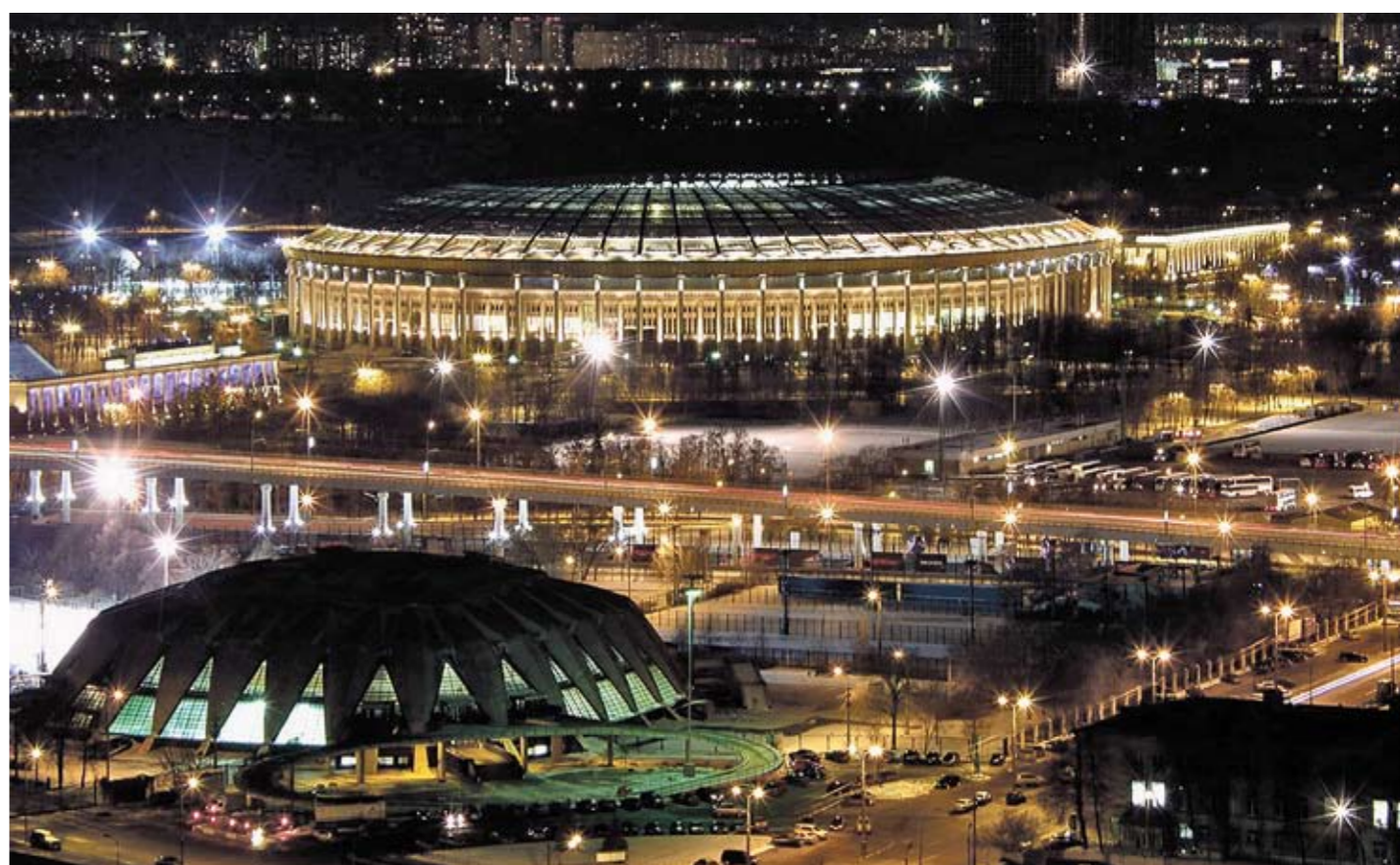
В центральной зоне «Лужников» появился главный олимпийский центр

Всего к Олимпиаде было построено более 70 крупных объектов. Причем 70% из них – руками московских строителей без привлечения иностранных фирм и специалистов.