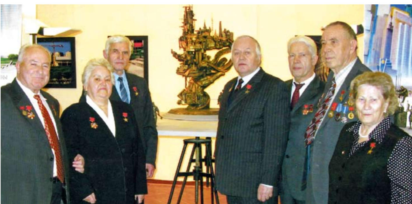
Макет монумента вынесли на обсуждение самых заслуженных строителей столицы

Предложение ветеранов-строителей возвести в столице монументально-скульптурную композицию, посвященную создателям Москвы – строителям, архитекторам и инженерам, – меня очень порадовало. Мы, архитекторы, поддерживаем эту прекрасную идею.