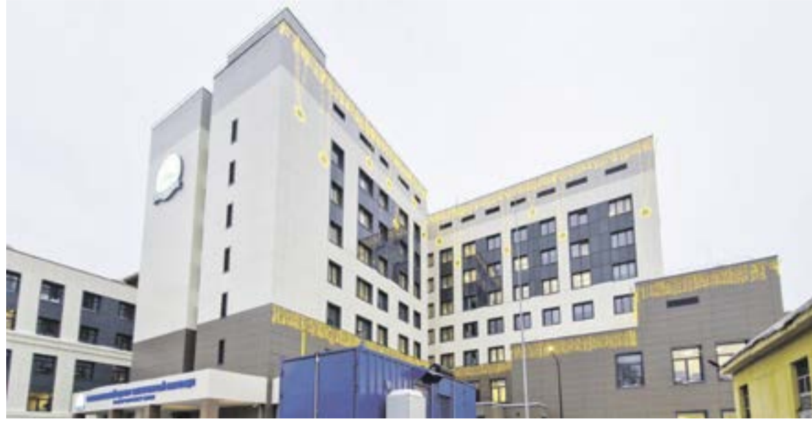
Мэр Москвы Сергей Собянин открыл флагманский центр городской клинической больницы № 1 имени Пирогова

К уже введенным в эксплуатацию московским флагманским центрам в ГКБ им. В.В. Вересаева, в НИИ скорой помощи им. Н.В. Склифосовского, в ГКБ им. О.Н. Филатова и в ММНҚІ им. С.П. Боткина в минувшую пятницу прибавился еще один – пятый по счету – ГКБ им. Н.И. Пирогова. От своих предшественников он отличается тем, что расположен не в специальном построенном здании, а в реконструированном корпусе больницы.