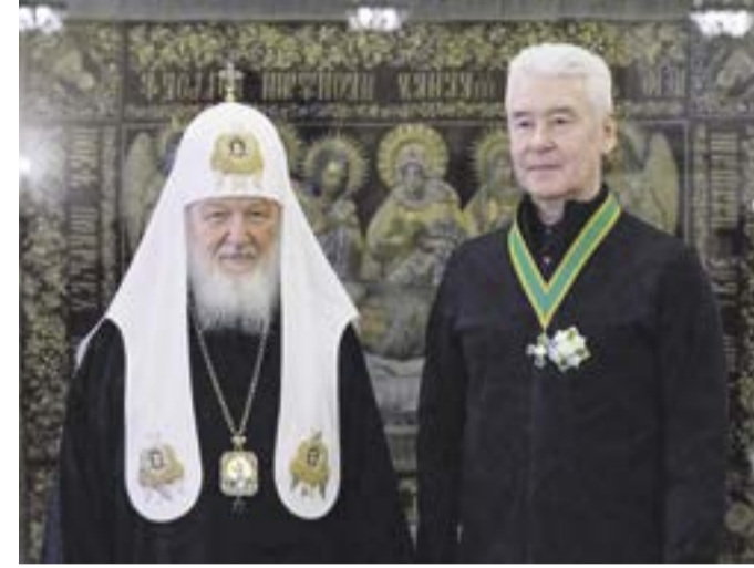
Патриарх Московский и всея Руси Кирилл и мэр Москвы Сергей Собянин

Мероприятие прошло в патриаршей резиденции в Московском Даниловом монастыре. Вручая за помощь Русской православной церкви мэру Москвы Сергею Собянину одну из самых высоких церковных наград – орден Преподобного Сергия Радонежского II степени, Патриарх Московский и всея Руси Кирилл поблагодарил главу города и его руководство за высокий уровень взаимодействия, существующий между правительством столицы и Патриархией.